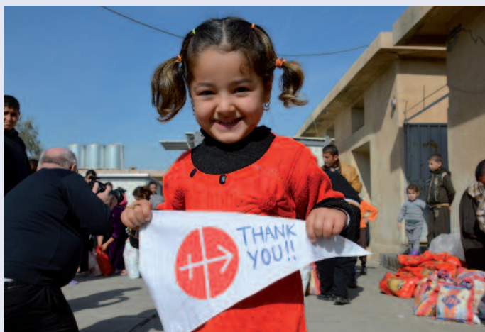
“Ohne Euch hätten wir keine Zukunft”: Der Dank des kleinen Mädchens steht für Millionen Christen.

Auch 2015 stand die Not der Christen im Nahen und Mittleren Osten im Mittelpunkt der medialen Aufmerksamkeit – und unserer Hilfe. Die Kosten für die Sofort-Hilfsmaßnahmen und auch für strukturelle Projekte haben sich mehr als verdoppelt und machen mittlerweile mehr als ein Fünftel (21,6 Prozent) des gesamten Budgets aus, übertroffen nur noch von Afrika mit 29,3 Prozent. Die Hilfe für Syrien verdreifachte sich. In allen Regionen ist in absoluten Zahlen ein Anstieg der Hilfen zu verzeichnen, von Osteuropa (um 1,5 Millionen), über Afrika (um 7,8 Millionen) bis zum Nahen und Mittleren Osten (um 11,5 Millionen). Aus Afrika kamen wie im letzten Jahr die meisten Hilfsgesuche, 2093 Projekte wurden bearbeitet, die zweitmeisten kamen aus Osteuropa und Asien/Ozeanien . Nach Afrika und Asien gehen auch die meisten Mess-Stipendien. Lateinamerika bleibt zwar der vitale, junge Kontinent, aus ihm gehen viele neue katholische Gemeinschaften hervor, aber Sekten und Drogen wachsen wie das Unkraut mit. Dort muss besonders viel in die Katechese investiert werden.