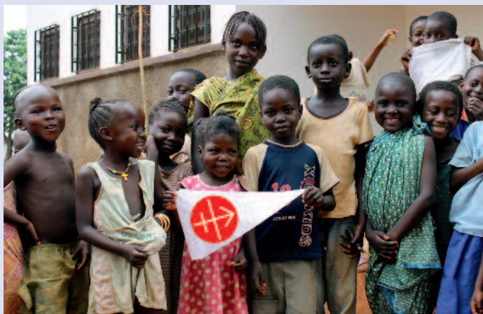
Ihre Zukunft ist auch unsere: Kinder aus der Zentralafrikanischen Republik sagen Danke.

Die steigende Anzahl der Hilfsanträge aus Afrika spiegelt auch das Wachstum der Kirche auf diesem Kontinent wider, sie macht mittlerweile 34 Prozent aller Anträge aus. Besonderes Augenmerk liegt auf den Ländern in der Sahelzone, auf Nordnigeria, Kenia, Tansania und Madagaskar – Länder, in denen sich eine aggressive Form des Islam ausbreitet. Im Nahen Osten, der Wiege des Christentums, schlägt die Not- und Existenzhilfe stark zu Buche. Sie sichert die Präsenz der Christen in der Region. In Asien braucht die Kirche nicht nur in den Ländern Hilfe, die unter dem Kommunismus litten und leiden – China, Vietnam, Laos –, sondern vermehrt auch in jenen Ländern, in denen ein radikaler Hinduismus oder Islam die Christen in Bedrängnis und Not bringt, etwa in Indien und Pakistan und auch in Teilen der Philippinen. In Mittel- und Osteuropa verlagert sich die Hilfe von Bauprojekten auf Aus- und Fortbildung. In den Fokus rücken in diesem Teil der Welt vor allem die Länder auf dem Balkan, wo ebenfalls radikale Formen des Islam den Christen das Leben schwer machen. Unsere Solidarität hilft den Christen auch dort, im Glauben standhaft zu bleiben.